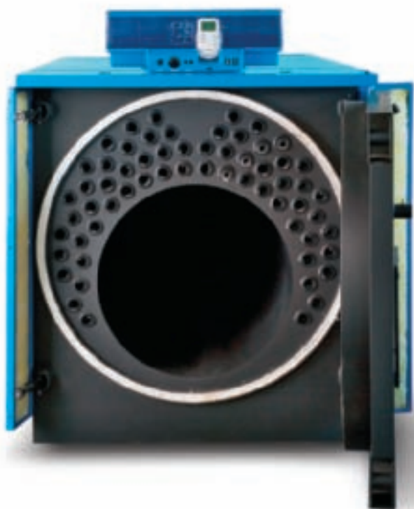
Logano SK 745

С расширением линейки оборудования новыми котлами Logano SK645\745 Вы можете реализовать оптимальное техническое решение для любого объекта теплоснабжения: крышные котельные для жилых зданий, бюджетные котельные для коммунальных предприятий, переоборудование существующих котельных промышленных предприятий и т. д. По Вашему заказу мы укомплектуем котел горелкой из программы поставок Buderus.